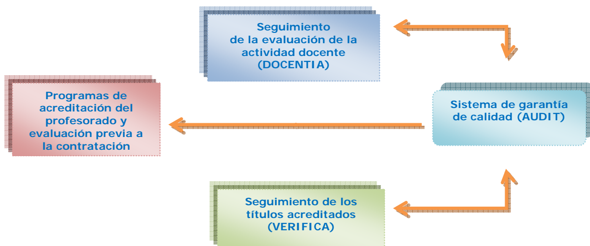
Figura 1: Retroalimentación entre AUDIT, DOCENTIA y VERIFICA

En consecuencia, el seguimiento de la evaluación de la actividad docente del profesorado aporta información necesaria para el seguimiento de los títulos acreditados que se imparten en esa Universidad.