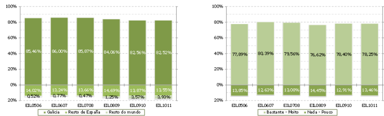
Figura 1. Distribución dos titulados segundo o lugar de traballo: Galicia, resto de España, resto do mundo. Comparativa dos seis últimos estudos.

Un caso diferente é o dos titulados en Artes e Humanidades II, onde a porcentaxe de titulados que traballan en Galicia é pouco inferior á do SUG (77,45%) e traballan noutra provincia española moitos menos ca no SUG (7,30%). Pola contra, un 11,35% traballa no resto de Europa e un 3,90% no resto do mundo (0,78% no total do SUG).