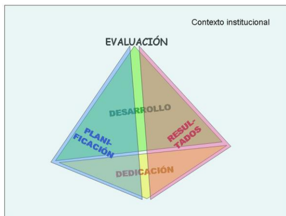
Figura 3. Dimensiones de evaluación de la actividad docente.