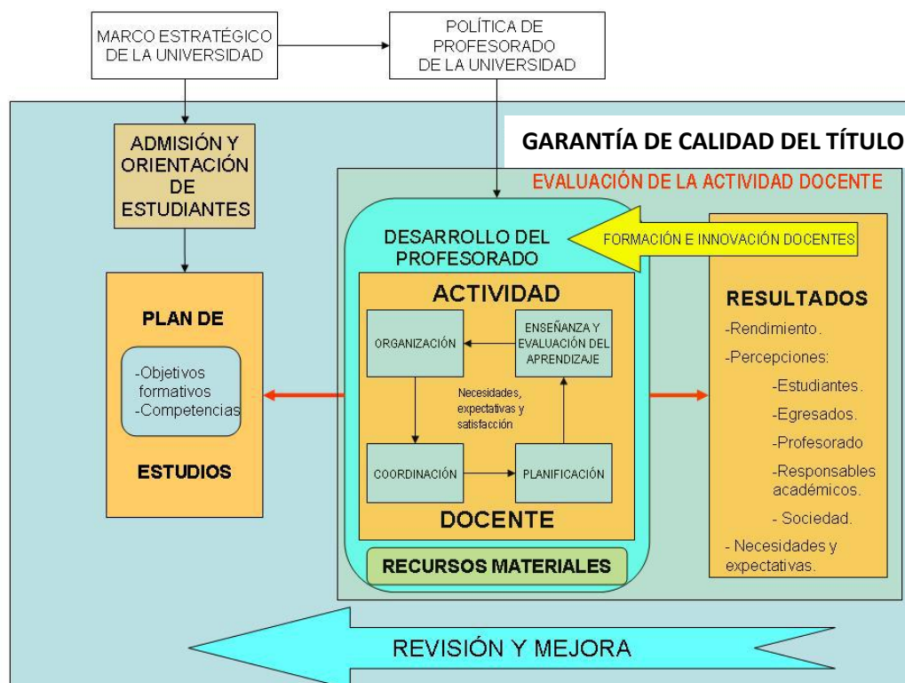
Figura 2. Plan de estudios y actividad docente

Los resultados de la actividad docente 7 , como factor esencial, se traducen en términos de los avances logrados en el aprendizaje de los estudiantes y en la valoración expresada en forma de percepciones u opiniones de estudiantes, egresados, responsables académicos y del propio profesorado. Los resultados de la actividad docente son también el fundamento de la revisión y mejora de los planes de estudios. De modo que, desde dichos resultados, se inicie un nuevo ciclo de formación.